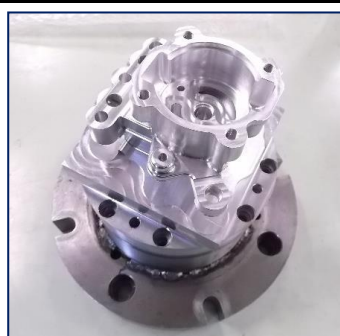
エンジンケーシング