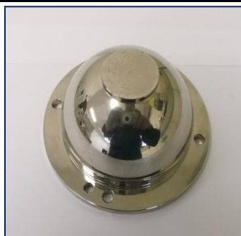
水晶発振子R加工用球面治具