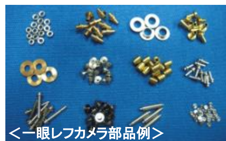
＜一眼レフカメラ部品例＞