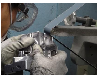
<サンダーによる細部バリ取り>