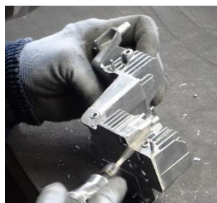
<特殊工具による仕上げ>