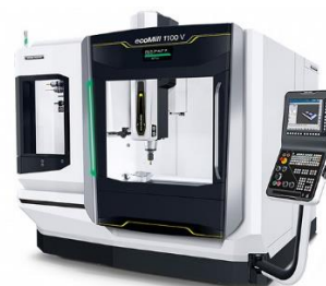
最新鋭マシニングセンター(森精機)