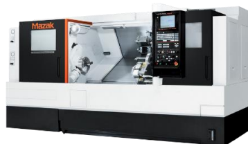
最新鋭 NC 旋盤(マザック)