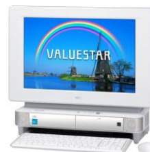
マイクロチャンネル技術で達成