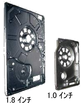
各種工法の組合せで製作(管理寸法300以上をクリア)