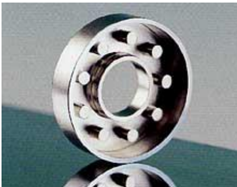
精密冷間鍛造部品 30年以上の功績