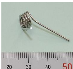
<パイプ・ワイヤー アッセンブル加工品>

複合旋盤(20台)、5軸マシニングセンタ(10台)、ワイヤ放電加工機(10台)などを駆使し、超精密加工を提供しています。