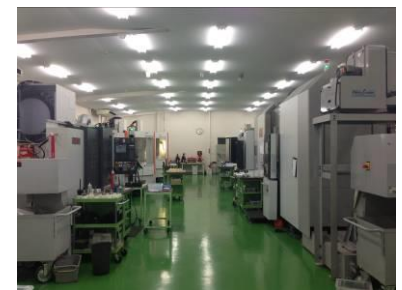
最新の 5 軸加工機と複合加工機