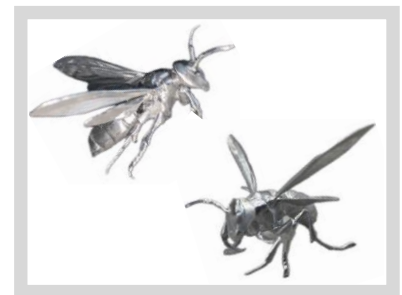
高精度な 5 軸加工サンプル

高速回転による精密切削から、重切削まで、バリエーション豊かな、同時 5 軸マシニングセンター…。複合加工機…。最新鋭の機械設備が、24 時間連続の無人稼働で、金属、樹脂、微細な製品から、大モノ製品まで、幅広く対応しています。