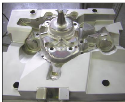
< 重鋳金型 >