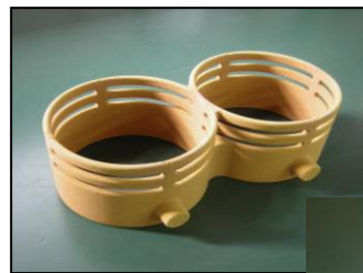
< 中子完成品: 複雑形状、 厚さ3mm >