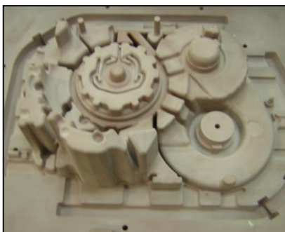
< 樹脂型 >