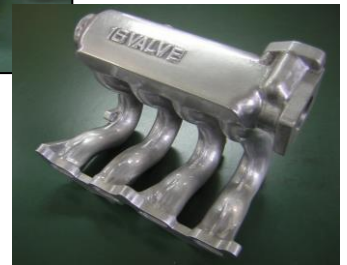
< アルミ鋳造品: 複雑形状、中空 >