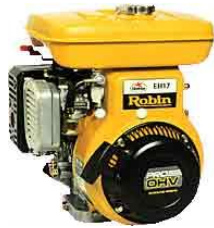
汎用エンジン部品