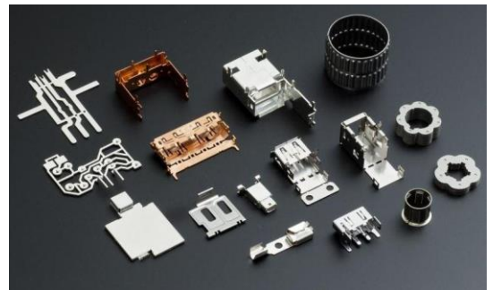
* 生産は1個～数万個(小ロット/中ロット) *