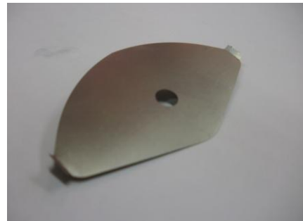
材料:ステンレス 304 バネ材 寸法:50mm × 20mm 板厚:t=0.05