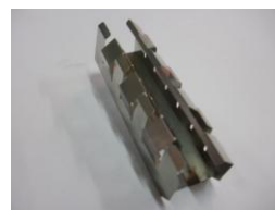
材料:ステンレス 304 バネ材 寸法:15mm × 50mm 板厚: t=0.1