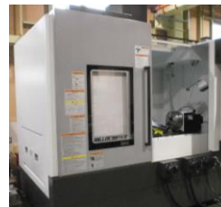
▲立形マシニングセンタ