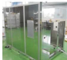
▲外筐部(ミガキパネル)