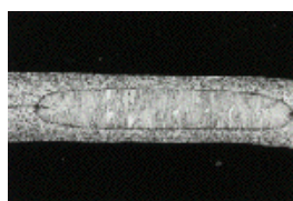
溶接部の断面写真