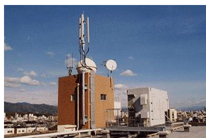
携帯電話基地局全景

国内携帯電話基地局のアンテナ重要構成部品のめっき皮膜として5年以上採用されています。