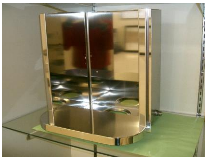
【SUS304 1.5t バフ仕上げ】 ＜給水器外観部品＞