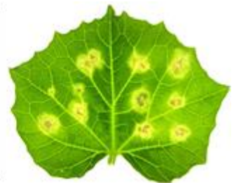
ウリ類炭疽病菌は植物表面に形成した侵入器官(左)を介して感染し、壊死病斑(右)を形成する