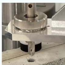
集塵ドリルでの採取状況

現場で短時間でかつ必要最少量の試料が採取できるため、作業者の汚染・被ばくが少ない。採取量が少ないため運搬が容易。高収率で回収ができ、試料への外部粉塵等の混入が少ない。