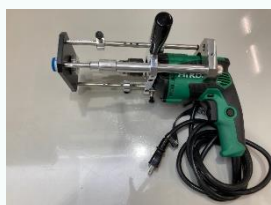
ハンディタイプの集塵ドリル