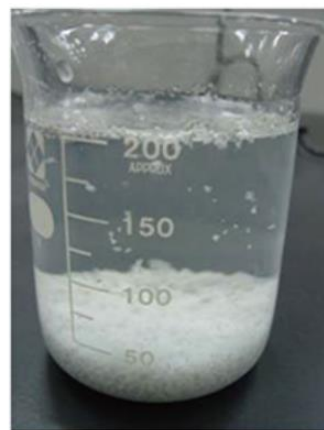
電解凝集法によりセシウムを凝集・沈殿させた例